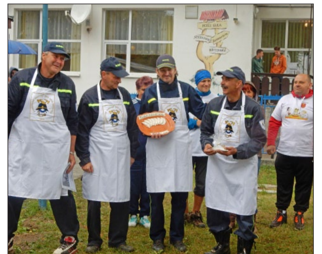
...a ako víťazi tohtoročnej súťaže vo varení najlepších batizovských pirohov.