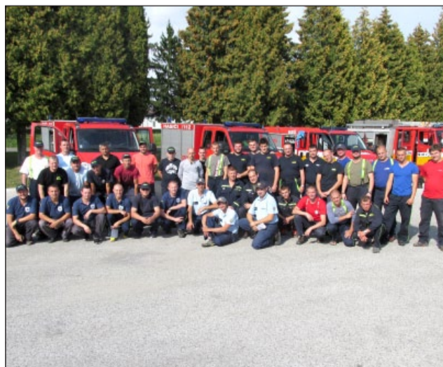
Dobrovoľní hasiči počas špecializovanej prípravy vo výcvikovom stredisku Lešť...

Končí sa 5-ročné volebné obdobie výboru DHZ, preto chceme pozvať všetkých členov na výročnú členskú schôdzu, ktorá sa bude konať 14. januára 2017, kde bude konkrétne vyhodnotenie a správy z jednotlivých oblastí a uskutočnenie sa aj voľba nového výboru. Veríme, že aj nové vedenie bude ku svojej dobrovoľnej práci pristupovať zodpovedne a bude zveľaďovať rozvoj dobrovoľného hasičstva v našej obci.