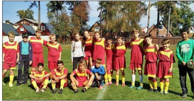
Družstvo chlapcov U 15.