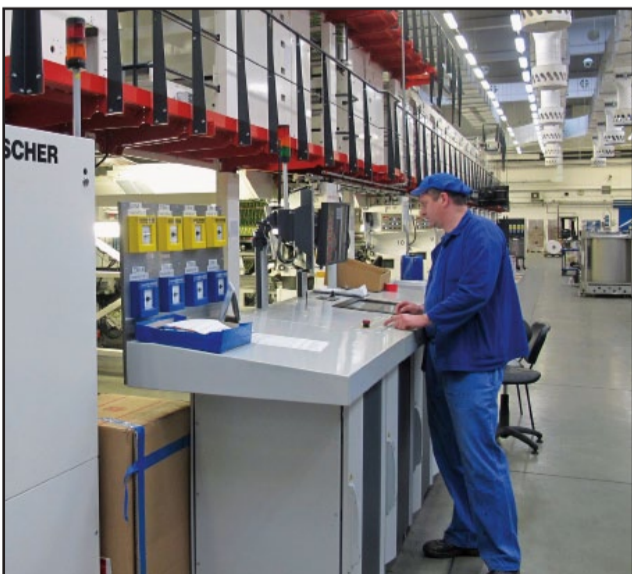
11-farebníkový hlbkotlačový stroj spĺňa najnáročnejšie požiadavky zákazníkov na obalové fólie.